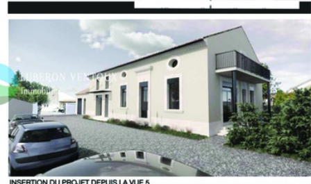
INSERTION DU PROJET DEPUIS LA VUE 5