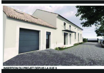
INSERTION DU PROJET DEPUIS LA VUE 3

Honoraires à la charge du vendeur, aucune procédure en cours, les informations sur les risques auxquels ce bien est exposé sont disponibles sur georisques.gouv.fr