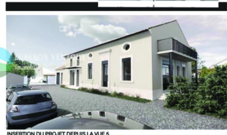
INSERTION DU PROJET DEPUIS LA VUE 5